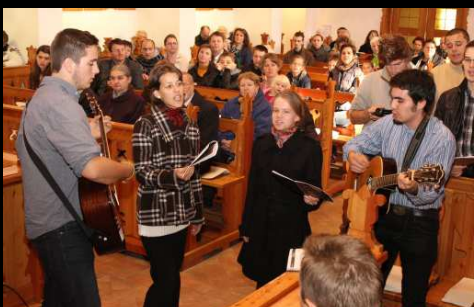
a REFISZ látogatása gyülekezetünkben