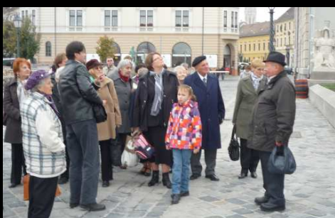
kirándul a diakóniai csoport