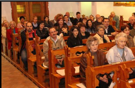
Beszélő színek evangélizáció