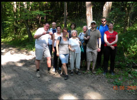
gyülekezeti kirándulás Fehérkőlapára