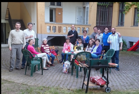
FeTa kör évadzáró alkalmá