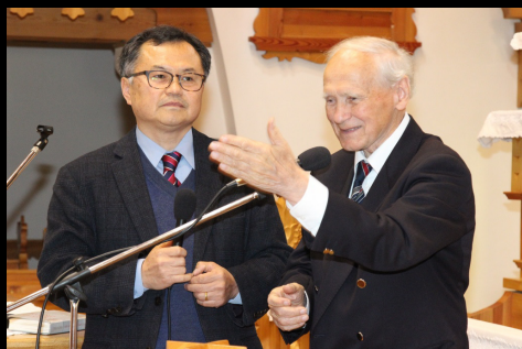
beszámoló a dél koreai misszióról