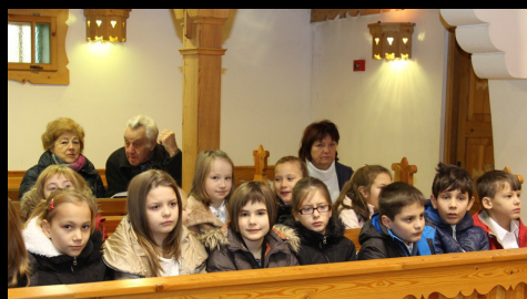
Jókais diákok szolgálata