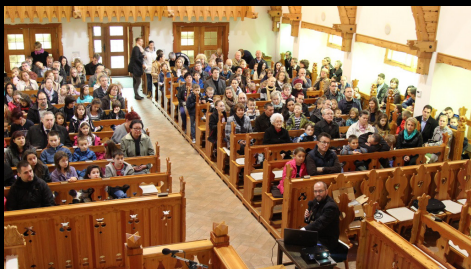
Jókais családi istentisztelet