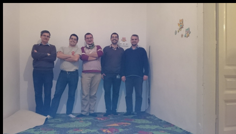
szépül a babaszoba