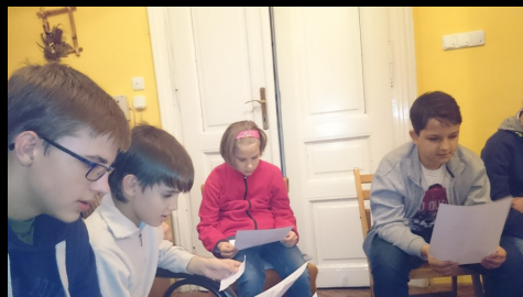
az új ifi