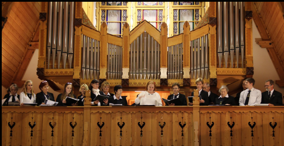
gyülekezetünk kórusa az egyházzenei kórustalálkozón