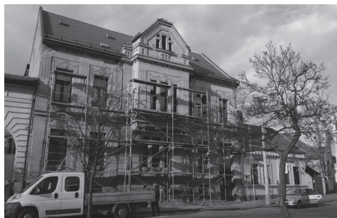
kezdődik a homlokzat felújítás

Az egyéb bevételek összege 3.087 eFt volt, ami 757 eFt-tal haladta meg a tervezetet. A növekmény döntő hányadát a párókai homlokzatának felújítása miatt felnyitott lekötött pénzeszközök hozama (459 eFt) adta.