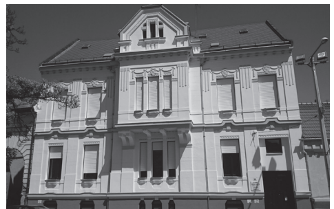
mégérte a fáradozást!