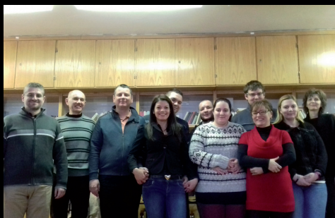
Keresztkérdések csendesnap Mályiban