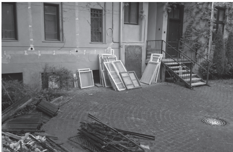
még minden csatátér

A 2017. év vonatkozásában az előző évi tényadatoktól kissé elmaradó bevételekkel kalkulált a presbitérium (22 440 eFt), figyelembe véve az egyházfenntartói járulékok és a rendes perselypénzek stagnáló, továbbá a stóla és a temetésekhez köthető adományok csökkenő tendenciáit. A kiadási oldalon a legnagyobb tételt továbbra is a személyi jellegű kiadások jelentik, 13 329 eFt-tal. Örömmel tájékoztatjuk a testvéreket, hogy kétévnyi stagnálás, továbbá a stóla jelentős részéről való lemondás után idén végre lehetőségünk nyílt lelkipásztoraink javadalmainak