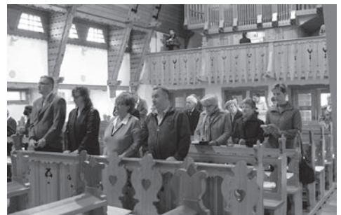
Diakóniai délután gyülekezetünkben