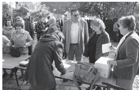
a szavazólapok átvétele