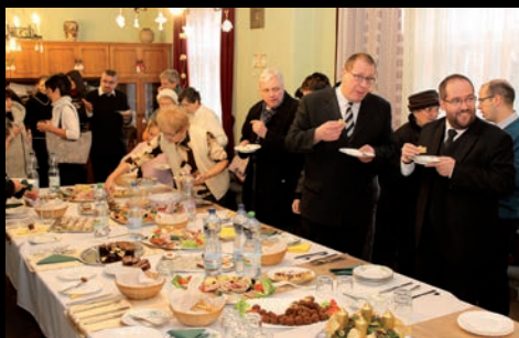
emlékistentisztelet és szeretetvendégség