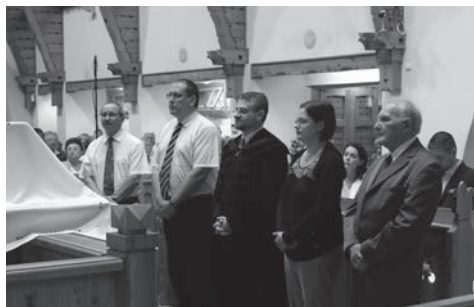
a jelölőbizottság fogadalomtétele

Őszintén megvallom – bár ezzel valószínűleg nem vagyok egyedül –, izgatottan vártam október 15-ét, a választás napját. Nem kevés volt a tétje ennek a tisztújításnak: ettől függ gyülekezetünk jövője, fejlődésünk iránya, és különösen az, hogy maradunk-e egy lassan kihalásra ítélt vasárnapi gyülekezet, vagy sikerül egy olyan közösséget formálnunk, amelyet mindannyian otthonunknak érzünk, és amely Krisztus szeretetét megmutatva körébe tudja vonzani és meg tudja tartani azokat a lelkeket, akikhez eddig még nem jutott el a megváltás örömhíre.