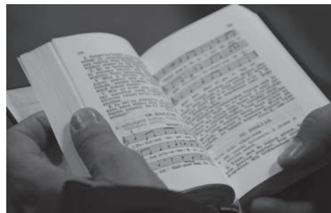
500 éve reformáció témahét és csendesnap Iskolánkban