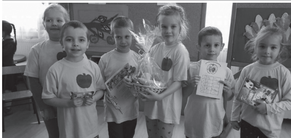
a Fecsegő almák csapata

Szeptembertől egy kívülről teljesen megújult épületben kezdhettük el a munkát. Aki arra sétál, bizony rá sem ismer a régi panel épületre. Ízlésesen kiválasztott színek, hőszigetelés és szép új ablakok gyönyörködtetik az odapillantó szemeket. Megújult az épület melletti járda is. Hálásan köszönjük a presbitériumnak és az iskolavezetésnek, hogy