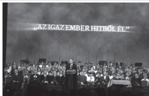
Reformáció 500 nemzeti megemlékezés