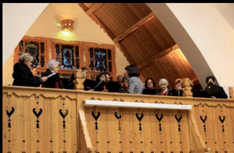
Adventi esték Gyülekezetünkben