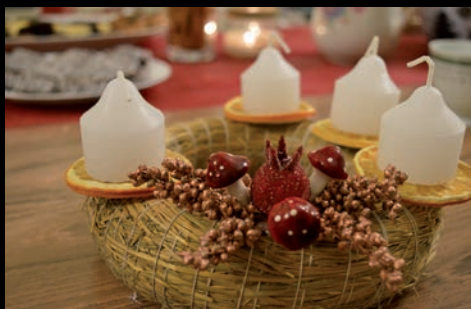
adventikoszorú workshop ifjseink részvételével