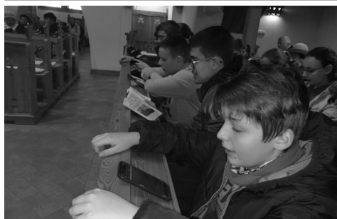
az énekeskönyvet mobilon néző konfirmandusok

beerősödését a gyülekezetbe. Persze tudjuk, hogy a megdöbbentő, már-már követhetetlen sebességgel változó világban a fiatalok és idősek között családban is egyre nagyobb a meg nem értettség, azért a mai fiatalok sem rosszabbak, csak mások. És jó, ha az idősek átadják nekik azt a tudást, tapasztalatot, amit máshonnan nem tanulhatnak már meg. Ugyanakkor el kell fogadni, hogy a világ folyását nem lehet megváltoztatni. Ma sok fiatal (akár a 40 évesek is) ha mobiltelefont tartanak a kezükben a templomban, szinte biztosan nem játszanak rajta. Ugyanis a modern technika segítségével ma már a mobiltelefonon rajta van sok embernek (nekem is!) a református énekeskönyv, rengeteg bibliafordítás (idegen nyelvűt, sőt az eredeti héber- és görög nyelvet is meg tudom nézni), térképeket nézhetünk meg, hogy egyes bibliai történetek pontosan hol is zajlottak. – Amikor ezt látjuk, értsük meg, hogy nem tiszteletlenség ez, hanem egy más világ szülőttei (a mellékelt fotón a mobilozó konfirmandusok éppen a 25. zsoltárt követik szemükkel és éneklik – direkt lefotóztam). Még én is úgy nőttem fel, hogy nem volt vezetékes telefonunk,