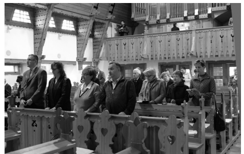
Diakóniai délután gyülekezetünkben