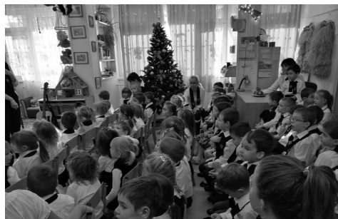
karácsonyi ünnepség az óvodában