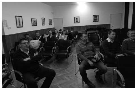
presbiteri csendesnap Mályiban