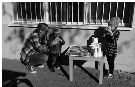
közösségi nap: udvar takarítás az óvodában