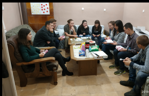
szülinapozik az ifi