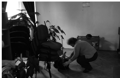
az utolsó finomítások