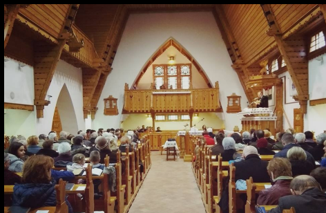
családi istentisztelet és szeretetvendégség