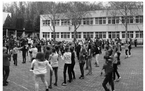
egészségnap a Jókaisban

Ötödik osztálytól több új tanárnőt és tanárt kaptam, akik a megszerzett alapismeretekre építve bővítették tudásomat. Hatodik osztály végén itt a Deszka-