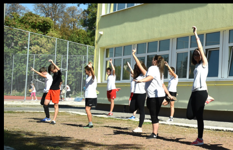
sportnap a Jókaiiban