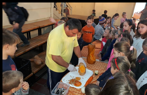
zöldségszobrászat és zöldségkóstolás a Jókaiiban