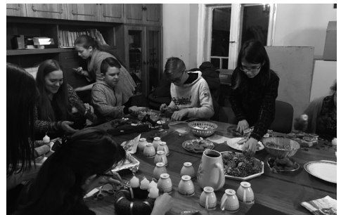
adventi koszorú készítés a gyülekezeti házban, működő konvektorok mellett :)