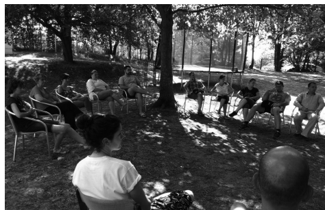
a tavalyi gyülekezeti tábor képei