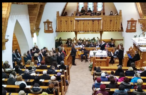
családi istentisztelet Gyülekezetünkben