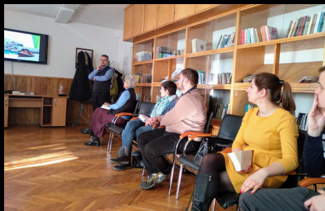
Keresztkérdések csandesnap Mályiban