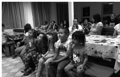
a tavalyi gyülekezeti tábor képei