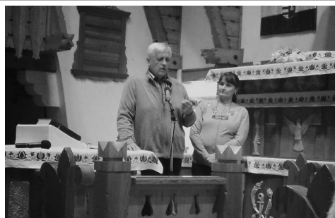
házasság hete Gyülekezetünkben