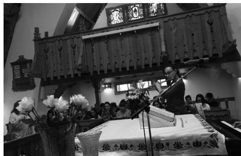
a Jókai 7. évfolyamának szolgálata Gyülekezetünkben