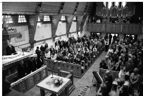
ünnepi istentisztelet Gyülekezetünkben