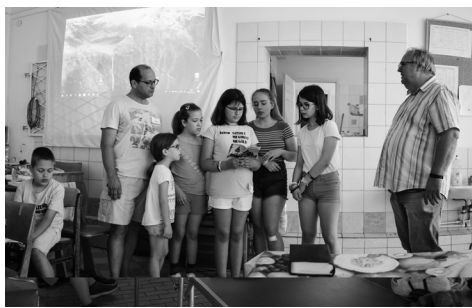
életkép a gyülekezeti táborból