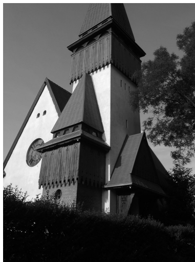
A mosonmagyaróvári ref. templom

veit többször átrajzolta, az apró részletekig kidolgozta a rajzokat. Eredményei alapján Miskolcon a város főépítészévé választották. Álnéven két pályázatot adott be a Deszkatemplom építészeti megvalósítására. Azért álnéven, mert a feladatkörével kapcsolatban a tervezés és annak engedélyezése összeférhetetlen lett volna. A pályázatot névtelenül is megnyerte. A Deszkatemplom felépült. Az építész politikai főbúne az volt, hogy Horthy Miklós figyelme és anyagi támogatása mellett Kenderesre református templomot tervezett. Ezért a háború után szakmai és politikai száműzött lett. Németországba emigrált feleségével. Nyugdíja nem lévén, magyaros motívumokkal díszített akvarellek eladásából maradt életben feleségével együtt. 1963-ban - amikor én egyéves voltam - halt meg Németországban elfeledett építész-ként. A sírkertünkben