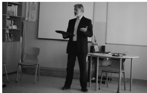
házaspári csendesnap képei