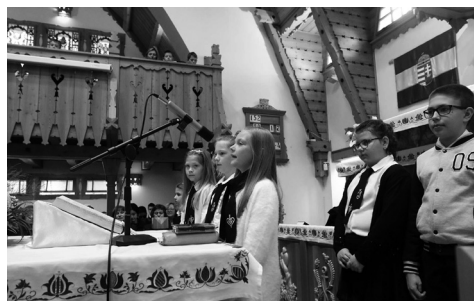
tanévnyitó istentisztelet Gyülekezetünkben