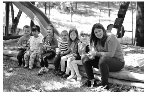
a legifjabb táborozók