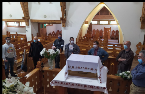
készülődés az első offline istentiszteletre