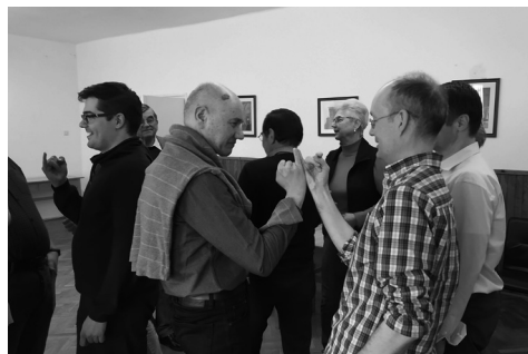
játék a presbiteri csendesnapon