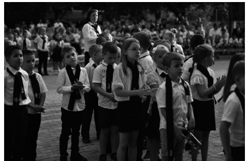
jubileumi tanévnyitó és épületátadó ünnepség