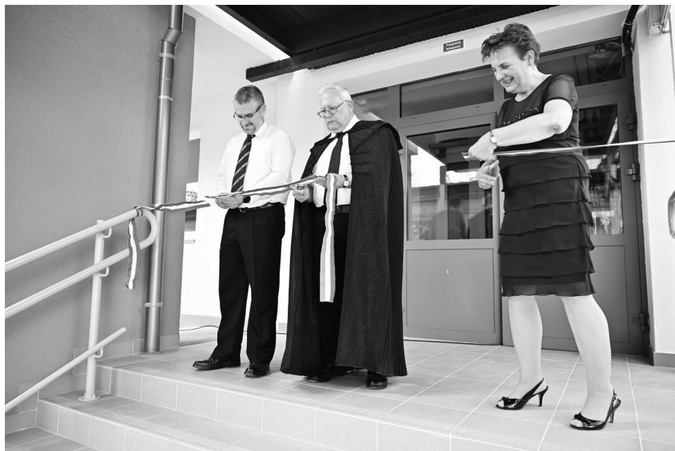
az új épületszárny ünnepélyes átadása