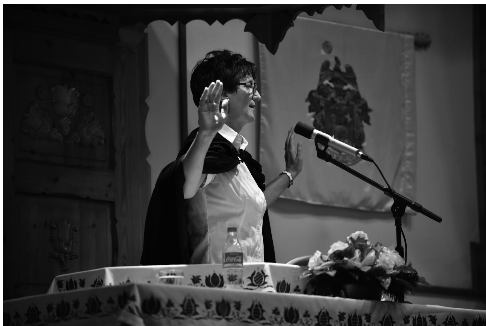
ünnepi istentisztelet a Deszkatemplomban