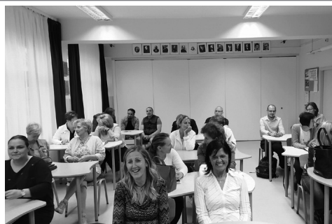
pedagógusnap a Jókaiiban