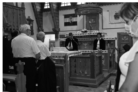
ünnepi istentisztelet a Deszkatemplomban