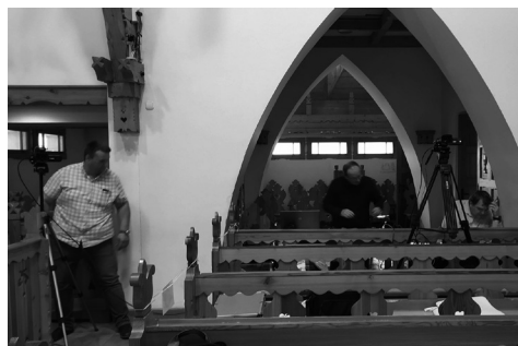
az ünnepi istentisztelet előkészületei