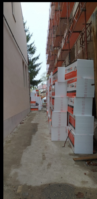
folyamatban a parókia felújítása